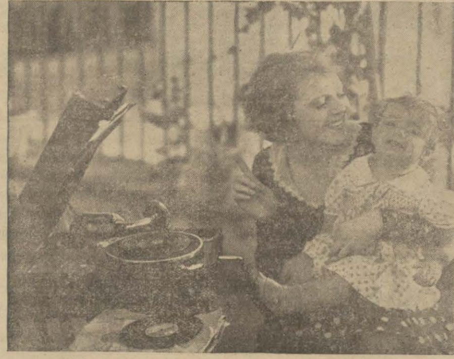
Son Ninni Filminden Ayrı Ayrı İki Sahne

Sinema mevsiminin tam ortasına girmiş bulunuyoruz. Bununla beraber itiraf edelim ki şehrin muhtelif sinemalarında, mevsim başlangıcındaki harareti göremiyoruz. Maamafih bu hafta gene büyük salonlar yeni programlar, yeni filmler göstermektedir. Mevzuları yazıyoruz: