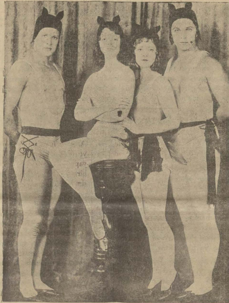
Dört Şeytanlar Bir Arada

Bu vaziyet karşısında Valker bu dört yetimi, kaba ve haşin müdürün elinden kurtararak hakiki birer sanat-kâr yapmaya karar verir ve dördünü de kaçıtır. Aradan geçen on mücadele senesinden sonra bu dört öksüzle birlikte Valker ilk zaferlerini kazanmışlar ve Parisin meşhur sirk-